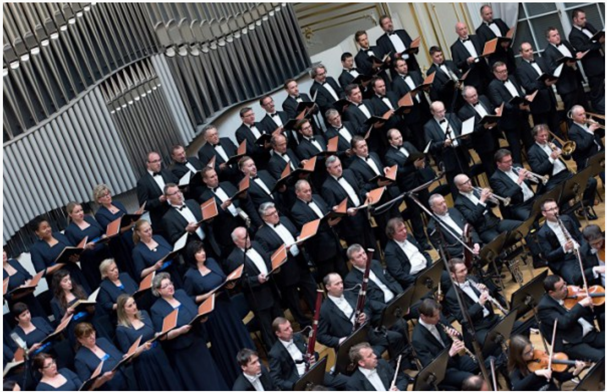
Veľkonočný koncert Slovenskej filharmónie, 2017, Slovenský filharmonický zbor, Slovenská filharmónia

Zbor i sóla sa v Rekviem prelínajú, jedine v Recordare a nadväzujúcom Jesu pie zaznejú postupne iba štyri hlasy sólistov. V ich vyznení znie mimoriadne pôsobivo veľká prosba ľudského individua o Božiu milosť nad ľudskými hriechmi pri Poslednom súde.