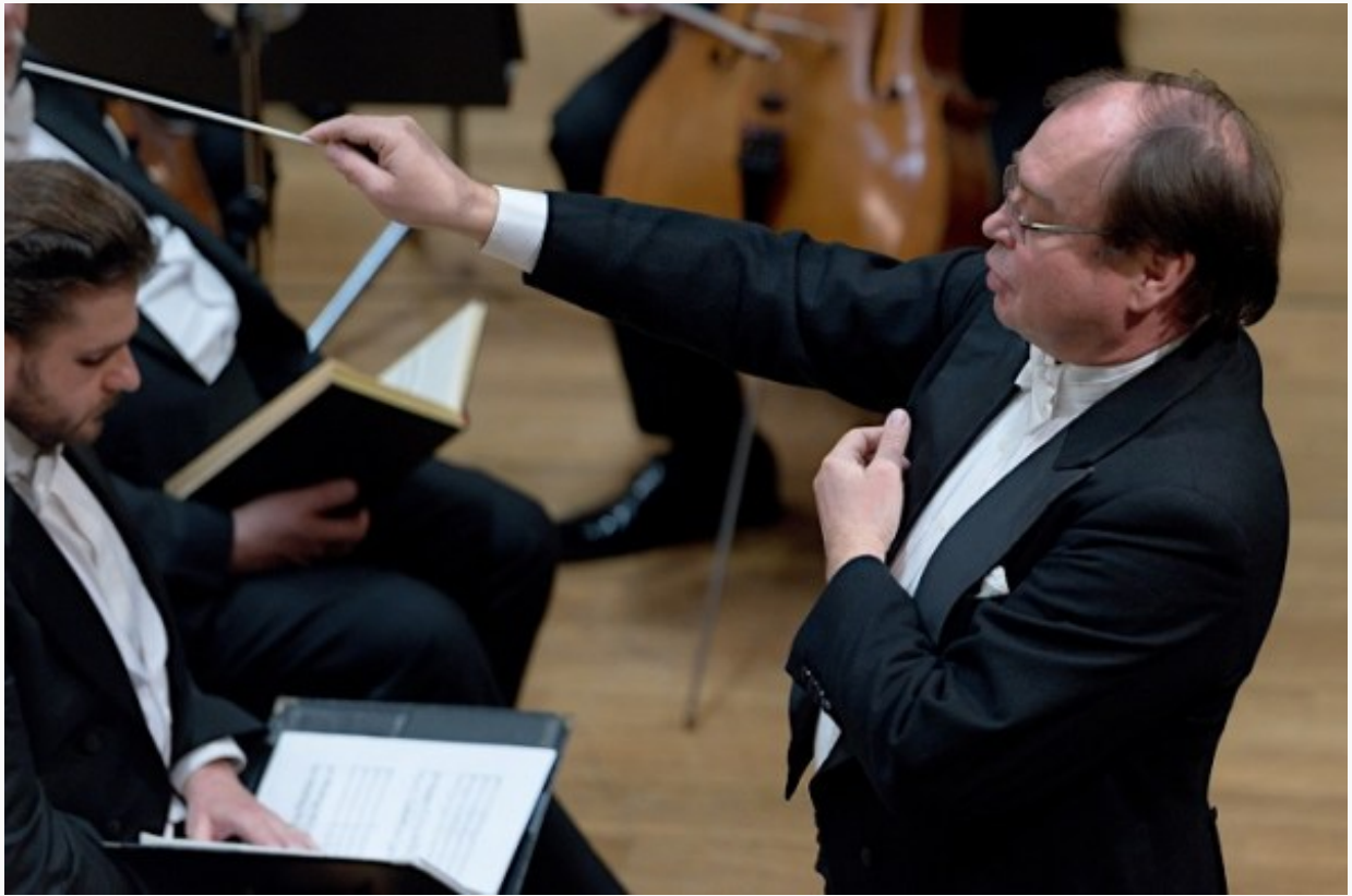
Veľkonočný koncert Slovenskej filharmónie, 2017, Leoš Svárovský, Slovenská filharmónia, foto: Ján Lukáš